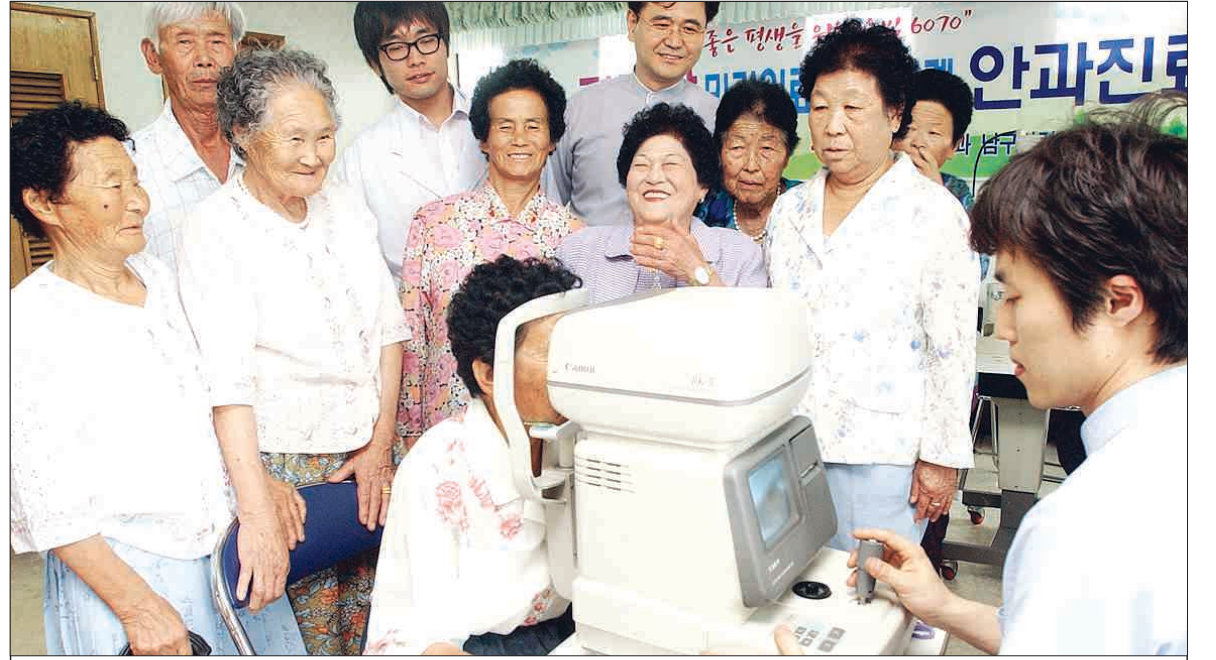
25일 오후 광주시 남구 구소동 구소보건진료소 2층 경로당에서 인근 마을에 거주하는 노인들이 무료로 안과진료를 받고 있다.

불가능하다”는 입장이다. 시 관계자는 “주민들이 기존 진입로 존치를 주장하지만 폐쇄가 불가피하다”며 “우회도로와 마을 진입로를 설계에 포함시켰는데 주민들이 반발하고 있어 마땅한 해결책을 찾지 못하고 있다”고 설명했다. 중심사 생태 복원사업은 2008년까지 500억원을 투입해 중심사 일대 상가와 주택 등 91동을 철거하고 8만9천256㎡에 나무와 꽃 등을 심어 자연생태를 복원하는 것이다. 시는 1단계 사업으로 지난해 2월 22일부터 23억7천여만원의 예산을 들여 운림동 운림중 앞에 철거되는 상가와 주택의 이주단지(3만9천㎡)를 조성하고 있으며 8월 완공 목표다.