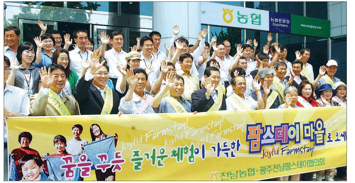
팜스테이 마을서 휴가 보내세요 기 캠페인 발대식을 갖고 있다.