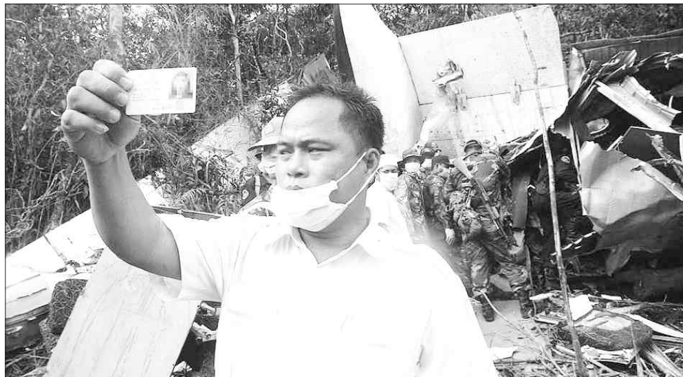
주인 잃은 주민등록증만... 27일 프놈펜에서 약 167km 떨어진 깊은 밀림지역에서 구조대원들이 추락 여객기에서 시신을 수습하던 중 발견된 한 한국인 회생자의 주민등록증을 들여다보고 있다. /프놈펜=연합뉴스

PMT항공 한국지사측은 “향후 사고 처리 절차 및 관련 발언은 한국 지사가 아닌 캄보디아 본사에서 채널을 일원화해 진행할 것”이라면서 구체적인 답변을 꺼리고 있다. /연합뉴스