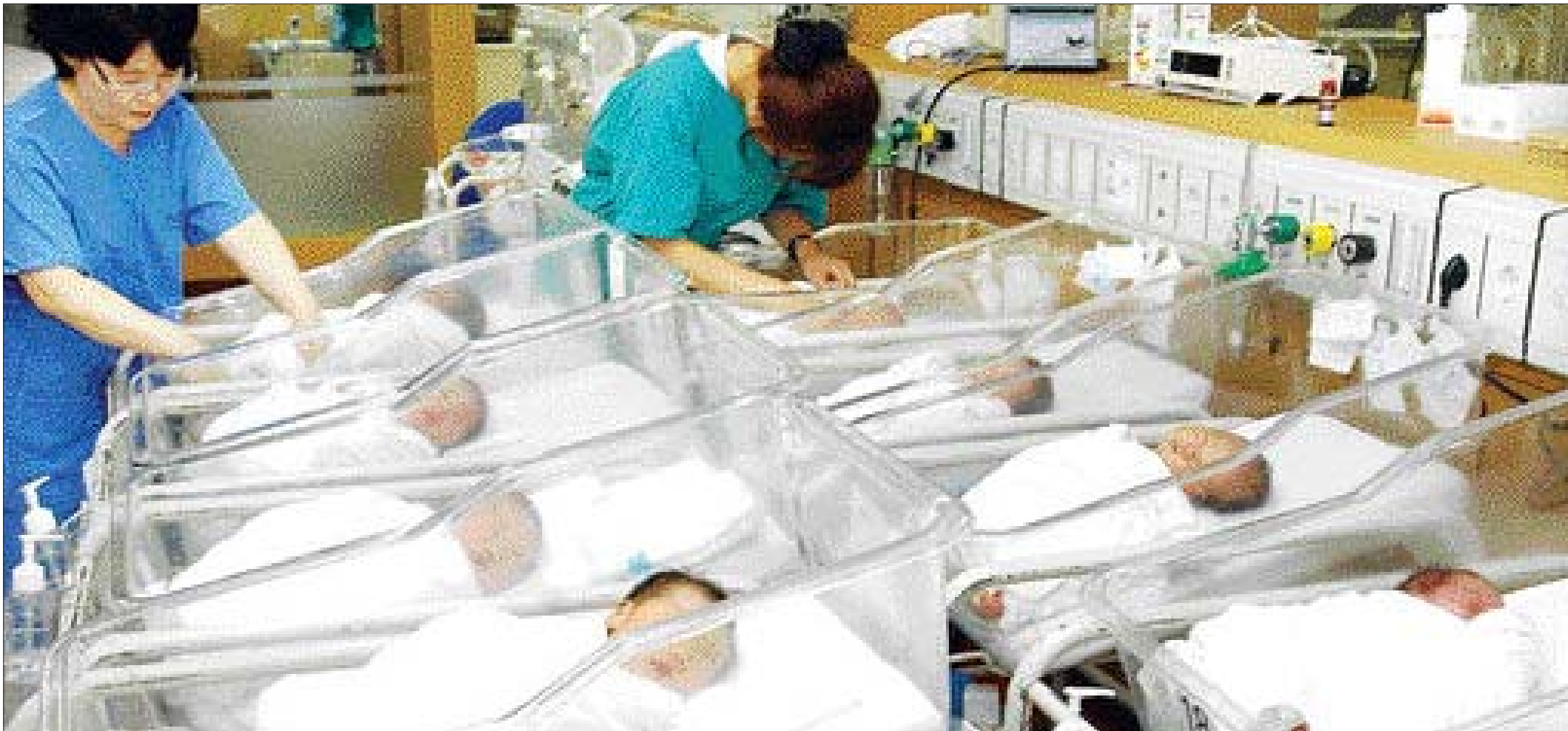
남자아이보다 여자아이를 더 선호하는 풍조가 신세대 부부들 뿐만 아니라 전 연령층으로 빠르게 확산되고 있다. 여자아이의 출생비율이 높고 있는 추세여서 지난 28일 조선대병원 신생아실의 경우 20명의 신생아 중 여아가 11명으로 남아보다 더 많았다.