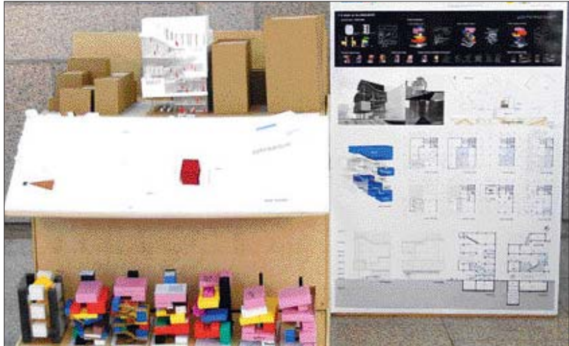
◇건축=홍유미·최승림·권은지 작 '셀의 상호작용 서점모형'