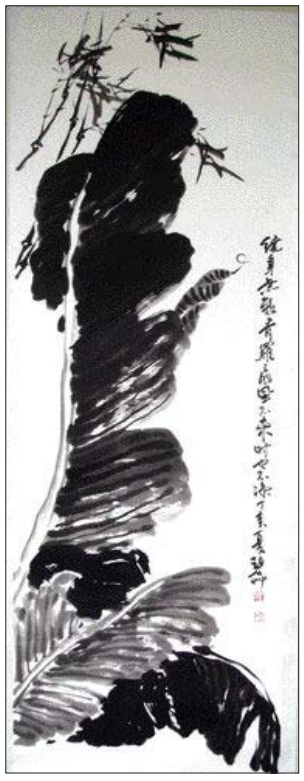
◇사군자=정철수 작 '파초와 대나무'