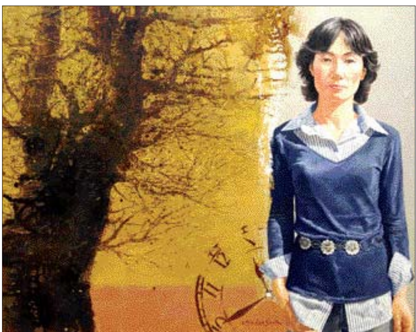
◇서양화=정해숙 작 '숨어 숨쉬는 시간'