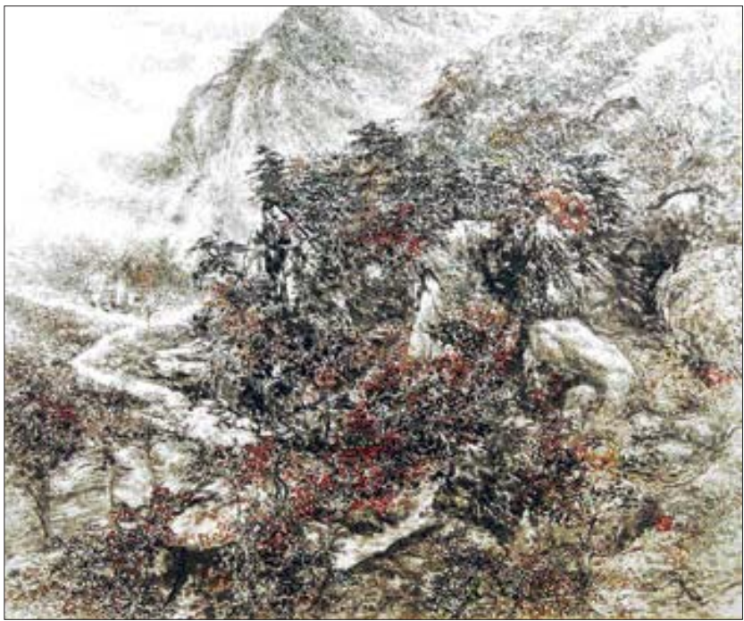
◇한국화=고영석 작 '우리산하'