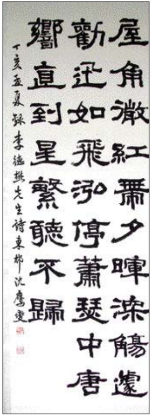
◇서예=심승섭 작 '이덕무 선생시'