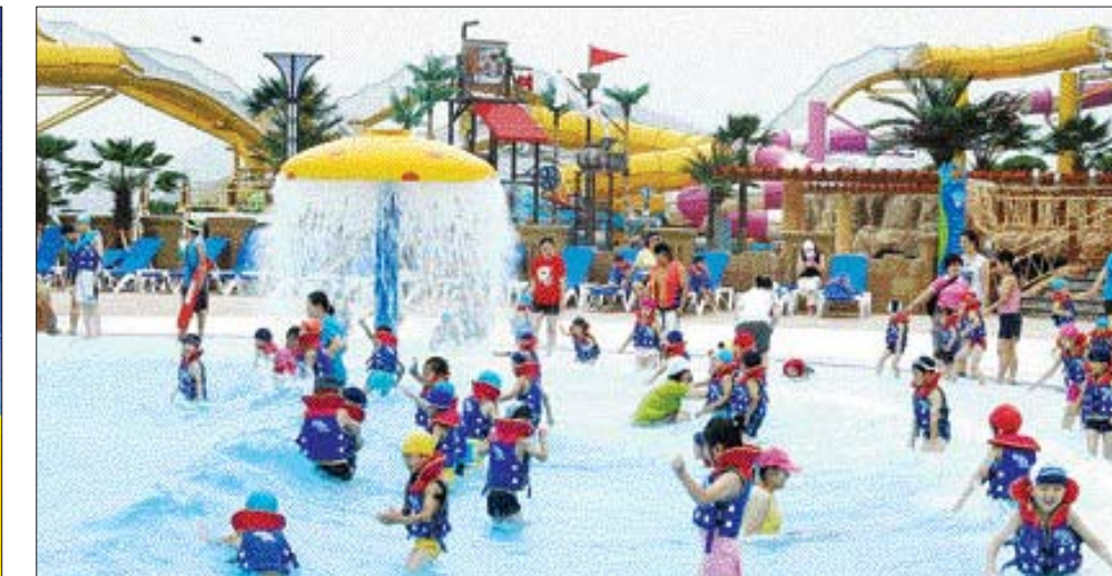
물폭탄을 맞으며 신나게 파도타기를 하고 있는 어린이들.