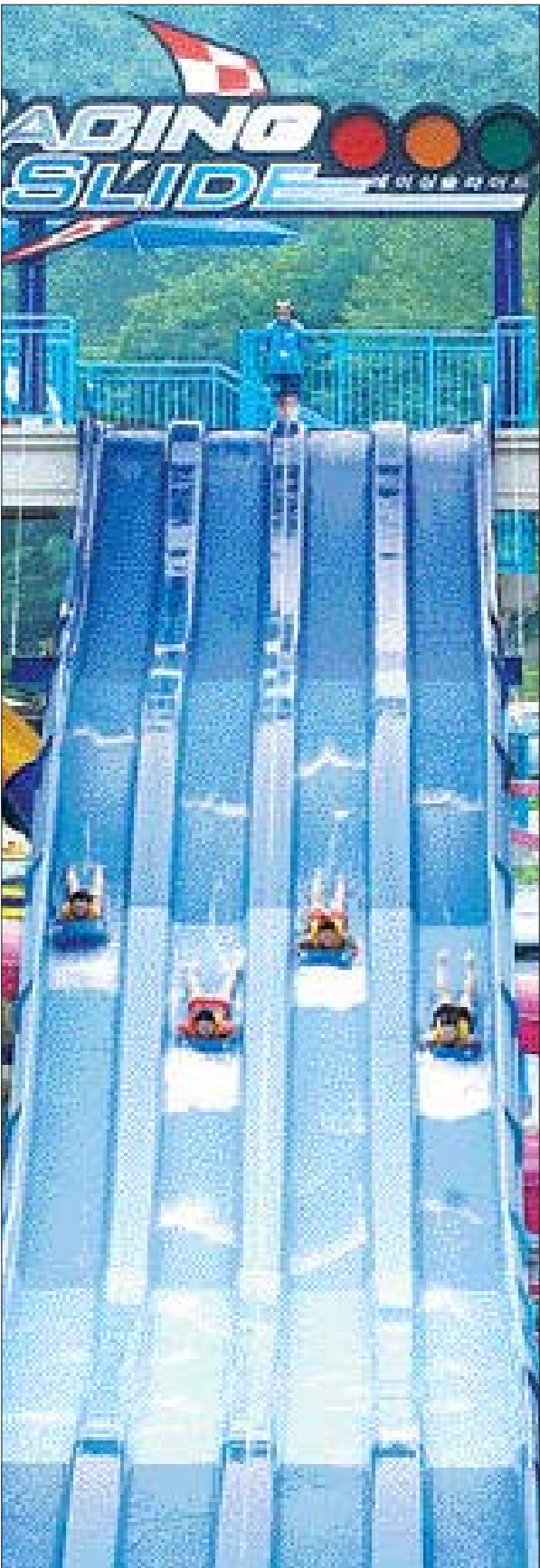
나주호를 내려다 보며 물살을 가르고 짜릿하게 미끄러지는 '레이싱 슬라이드'.