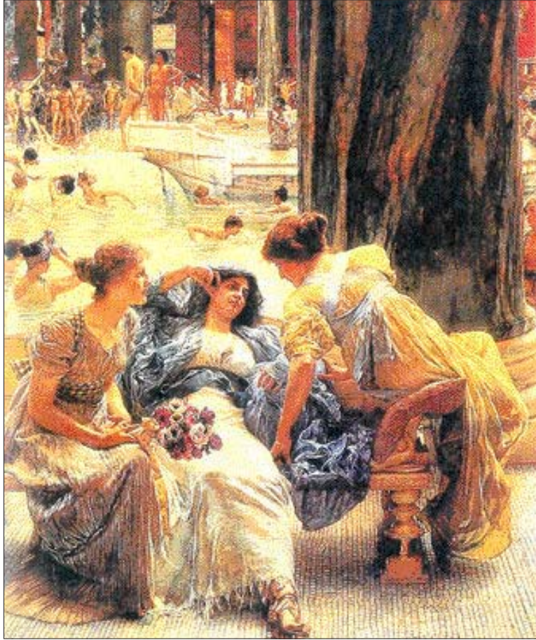
카리칼라의 목욕탕. 이 목욕탕은 냉탕실, 온탕실, 한증실 외에도 큰 홀, 도서실, 점포, 경기장 등을 갖추고 있었으며 한 번에 1천600명을 수용할 수 있었다.

새의 깃털로 목구멍을 간질여서 먹은 것을 토해 내고 다시 먹기를 반복했다'는 기록이 이를 대변한다.