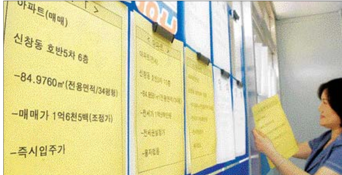
이달부터 '평'과 '돈' 등 비법정계량단위 사용이 금지되면서 관련 업계가 소비자의 혼선을 줄이기 위한 방안 마련에 고심하고 있다.

이달부터 '평'과 '돈' 등 비법정계량단위를 사용하지 못하도록 한 '계량에 관한 법률' 개정안이 시행되면서 시장 곳곳에서 혼란이 빚어지고 있습니다.