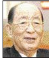
이복량 전 전남도 부지사가 지난 8일 밤 별세했다. 향년 94세.

여수 출신인 고인은 1939년 보통문관 시험에 합격한 후 전남도 내무·보건사회국장, 부지사 등을 역임했다. 유족으로는 전남지사와 농림부장을 지낸 이호계씨 등 2남2녀가 있다.