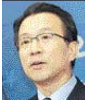
정보2과·특수정책과·동북아1과장과 주일본 공사, 동아시아협력대사 등을 지냈다.

출입국·외국인정책본부는 전국 16개 출입국 관리소를 관리하고 국내 거주 외국인 보호정책을 총괄하며 18일 시행되는 재한 외국인 처우 기본법에 따른 외국인 정책 관련 기본계획을 만드는 업무도