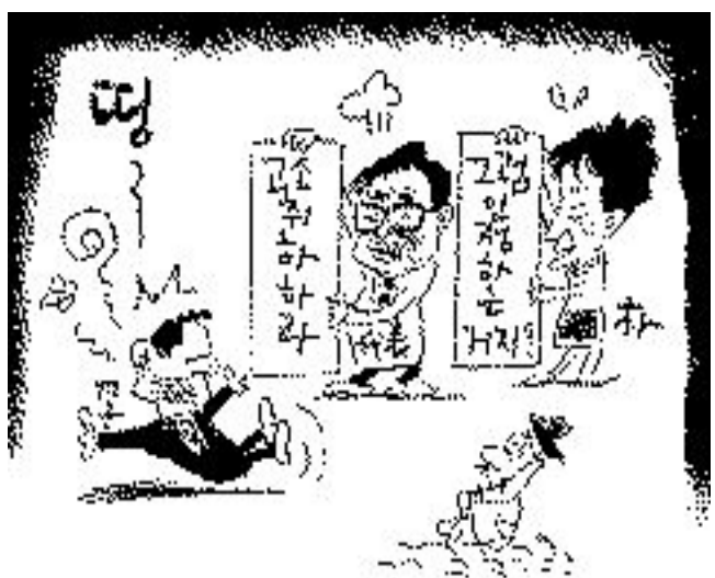
경선때까지 몸이 성할까 싶다