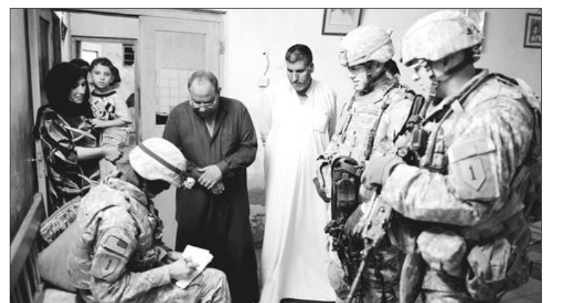
미 32야전포병연대 소속 2대대 병사들이 9일(현지시간) 바그다드 거리에서 아간 순찰 중 한 집에서 이라크인들과 이야기를 나누고 있다. (로이터=연합뉴스)

양측은 5월 서울에서 열린 1차 협상에서 일부 농산물은 개방에서 제외할 수 있다고 합의했고 공산품 관세를 협정 발효 10년 내에 모두 철폐하자는 원칙을 정했으며 관세양허 방식은 즉시 철폐와 3년 내 철폐, 5년 내 철폐로 단순화하는 대신 민감품목에 대해서는 관세 철폐기간을 별도로 정하기로 했다. (연합뉴스)