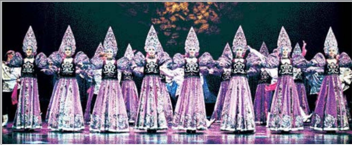
제2회 광주국제공연예술제에 참가하는 모스크바 국립 그젤무용단의 공연 모습.