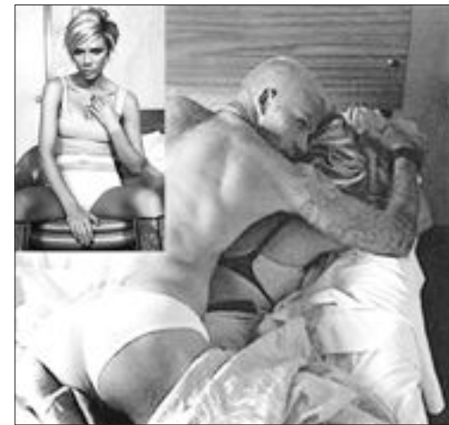
최근 미국 패션매거진을 통해 공개된 데이비드 베컴 부부의 섹시 화보.