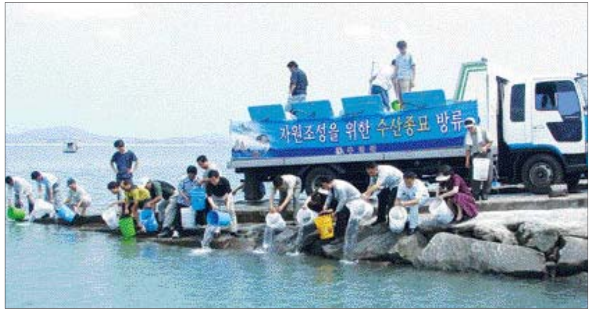
감성돔·넙치 치어 방류 무안군이 지난 12일 현경면 흥동 선착장 등 5곳에서 고부가가치 주요인 감성돔 치어 14만3천마리와 넙치 치어 9만5천마리를 방류했다. 군은 지난 5월에도 현경면 일대 해역에 대해 350만 마리를 방류했으며 올 하반기에는 송어와 감성돔 등을 추가 방류할 계획이다. /무안=이원희기자 whlee@

흥익저축은행 영업이 정상화되면 5천만원(원리금 기준)이하 예금주들은 약정 금리를 예아름 저축은행에서 그대로 적용받게 되며 예·수신이 자유롭게 이뤄져 경제적 피해를 입지 않게 됐다. 그러나 5천만원 초과 예금자들은 5천만원까지 보험금을 지급받고 초과 금액은 법원의 파산절차를 거쳐 배당 받게 된다. /목포=이상선기자 sslee@