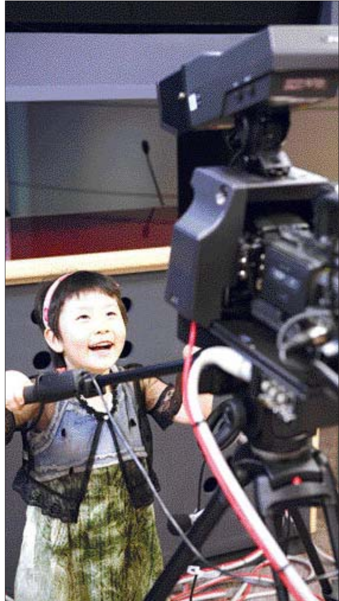
광주시청자미디어센터는 다양한 교육·체험 프로그램을 통해 시청자들이 미디어와 친근해질 수 있는 기회를 제공하고 있다.