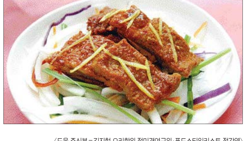
(도움 주신분 = 김지현 요리박사/정미경연구원·푸드스타일리스트 정강영)

을 녹이는데도 도움을 준다. 기름기가 많은 음식을 주로 먹는 중국인들은 레몬이 지방의 분해를 촉진해 비만을 예방할 수 있다고 믿었기 때문에 즐겨 먹었다.