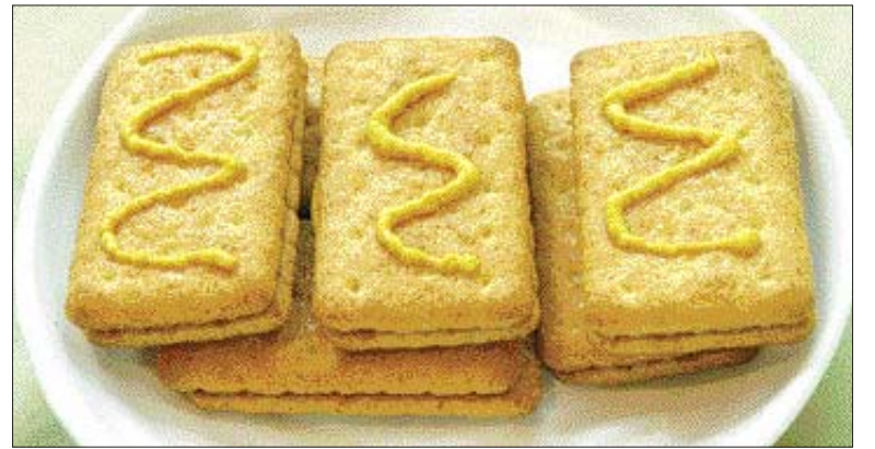
▲레몬 쿠키=①말가루, 버터, 황설탕, 베이킹 파우더, 다진 레몬겉질을 넣고 반죽한 다음 설탕에 굴러 180도에서 15분 구워낸 다음 레몬버터를 바른다.