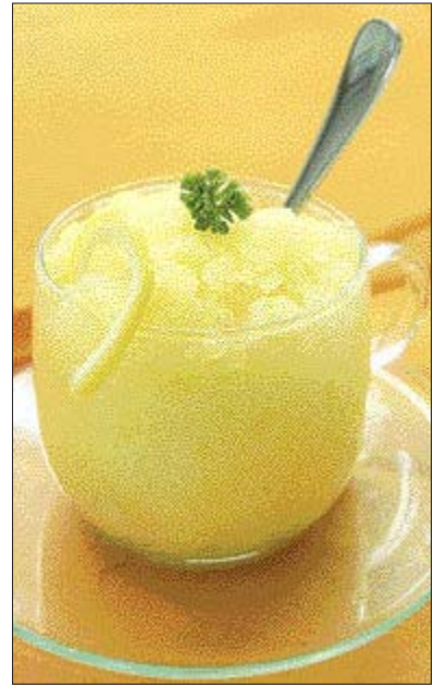
▲레몬 사베트=①레몬즙, 설탕, 사이다, 양주를 한 방울 정도 넣고 고루 섞어 냉동실에 얼린 다음 숟가락으로 긁어 다시 얼리기를 3~4번 반복한 다음 유리병에 담는다.