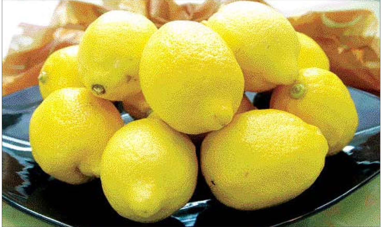
레몬은 알칼리성 식품으로 말갈류 가운데 비타민C와 구연산을 가장 많이 함유하고 있는 웰빙식품이다.