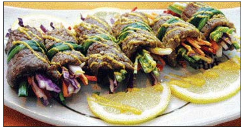
▲레몬소스 쇠고기 야채말이=쇠고기는 불고기 양념하고 각종 채소를 채를 썰어 넣고 말아 익힌 다음 레몬소스를 뿌린다.