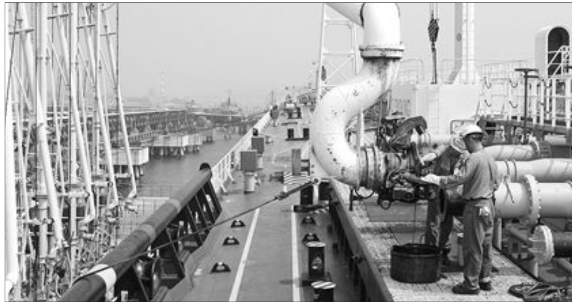
對北지원 중유 마지막 선적 지난 28일 울산시 남구 SK에너지 돌핀부두에서 기름선적 설비 인 로딩임을 통해 대북 지원 중유의 마지막 물량이 중국선적 '반 공후' 호에 실리고 있다. 이 배는 29일 북한으로 출항했다.