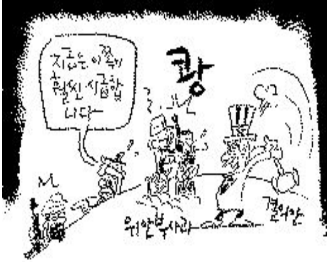
‘인질 석방 결의안’ 이라도...