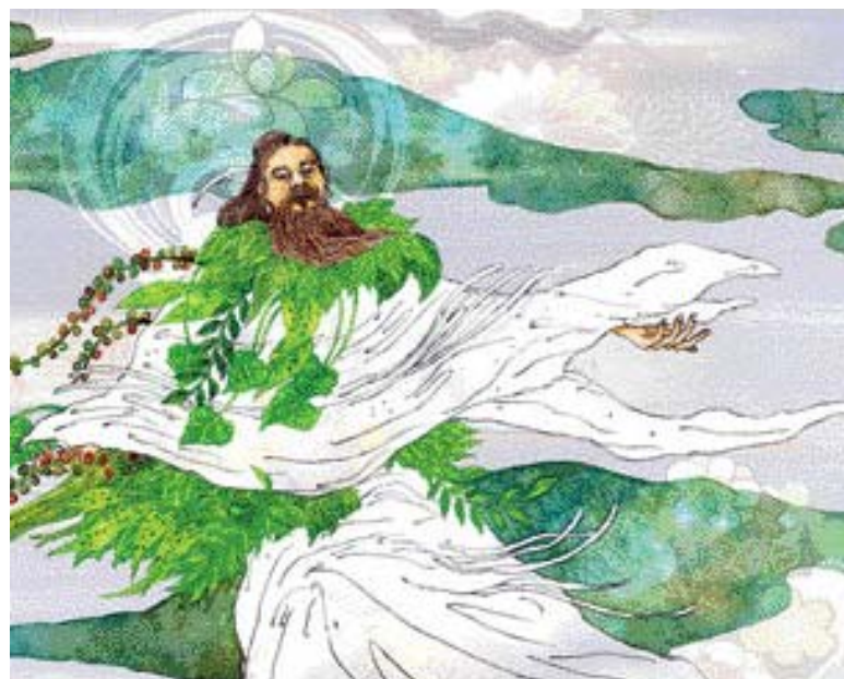
우리나라의 대표적인 신화인 단군 신화는 하늘에서 내려온 환인과 환웅으로부터 유래한다.

많은 독자들에게 이윤기는 그리스 로마신화와 동서의어로 읽힌다. 출간 후 100쇄를 넘긴 '이윤기의 그리스 로마 신화'를 비롯, 그가 펴낸 신화 관련 서적을 읽어본 사람들은 그의 맛깔스런 글쓰기와 해박한 지식이 어우러진 '우리 신화 이야기'를 내심 많이 기대했을 것이다. 이 씨가 최근 펴낸 '이윤기 우리 신화 에세이-꽃아 문 열iera'는 그런 독자들에게 반가운 책이다. 단군과 웅녀, 주몽과 유리 태자, 박혁거세와 알영, 호동왕자와 나랑공주, 유화부인, 염제 신농 등 우리 신화 속 인물들은 전작의 포세이돈, 하데스, 푸쉬케처럼 생생하게 살아 움직인다. 책은 고백으로부터 시작한다. 그는 고대 그리스의 서사 시인 호메로스의 고향 터키의 이즈미르까지 찾아다니면서 정작 '한국신화의 보물창고'인 '삼국유사'가 씌어진 장소가 자신의 고향인 경북 구미군의 인각사라는 절이었다는 사실을 몰랐던 일을 부끄러워한다.