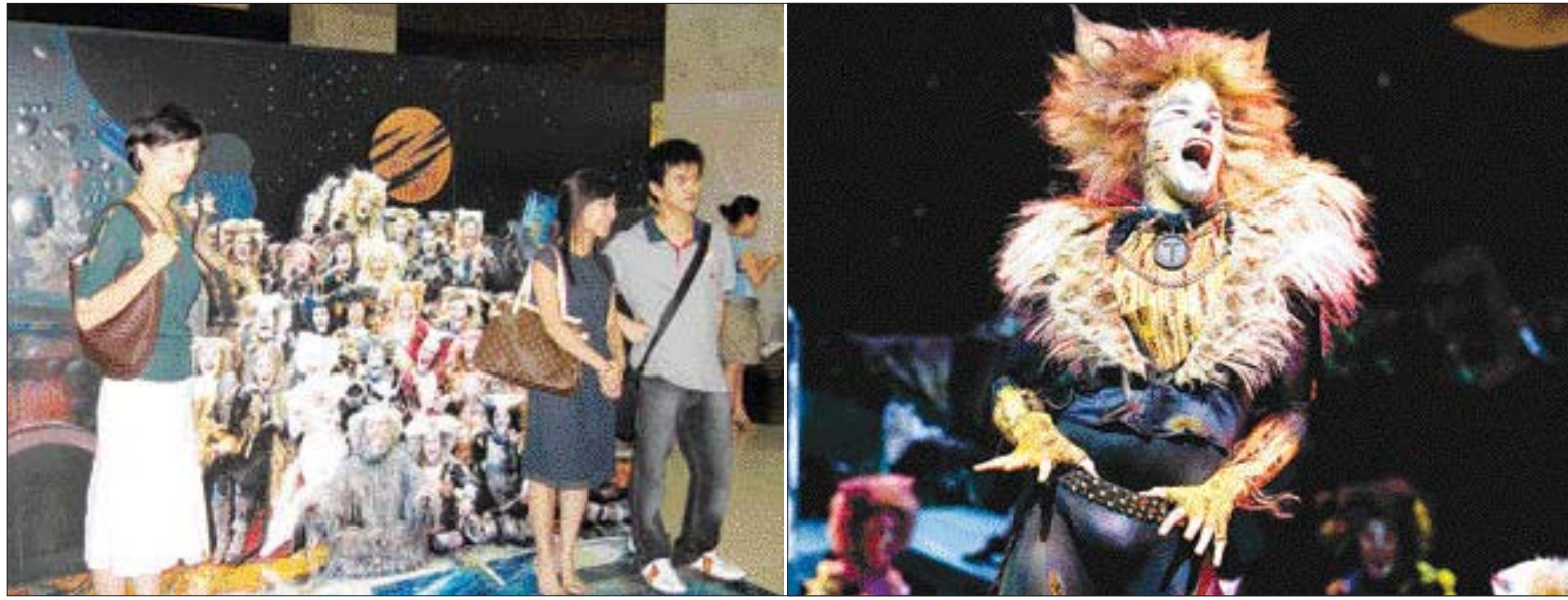
지난 3일 서울 국립극장에서 열린 '캣츠' 공연을 관람한 관객들이 고양이 캐릭터 모형 앞에서 기념 사진을 찍고 있다. 오른쪽 사진은 가장 인기 있는 캐릭터 비람둥이 고양이 림 텡 터거.

사람들이 고양이들의 매력에 흠뻑 빠졌다. 흥겹고 유쾌한 고양이들이 벌이는 펠릭스 축제에 초대받은 사람들은 고양이들과 2시간 40분간을 함께하며 잊지 못할 추억을 만들어 갔다. 최근 10만 관객을 돌파한 '캣츠'에 관심이 쏠리고 있다.