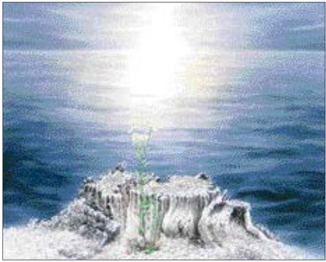
▲서양화=한부철 작 '바리보다 갯벌'