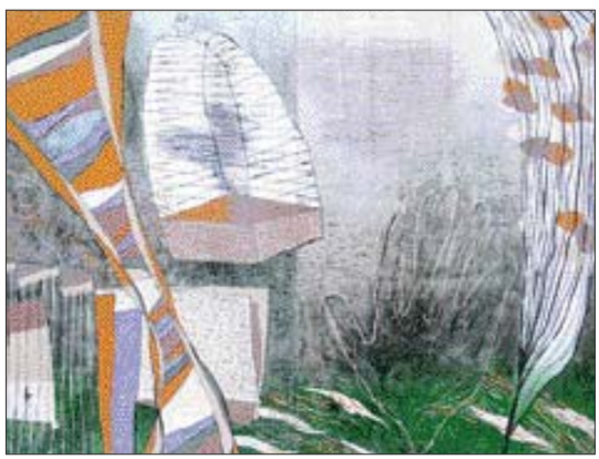
▲판화=김보람 작 '형이상학적인 풍경 1'