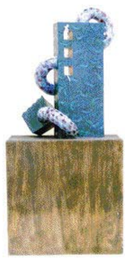
▲공예=오상문 작 '달콤 쌉싸래한 여행'