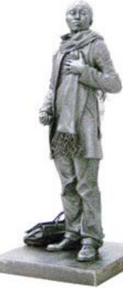
▲조각=서승원 작 '대자부'