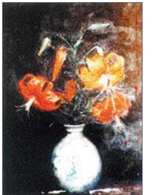
광주 전남 최초 서양화가인 김흥식 화백의 '나리꽃'

290쪽에 달하는 이 책에는 구한말부터 1945년까지 광주 전남 미술사 선각자인 화포 양광손, 공재 윤두서, 소치 허유 등 대표적인 작가들의 생애와 작품이 수록됐다. /윤영기기자 penfoot@kwangju.co.kr