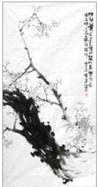
▲문인화=박종삼 작 '맑은 향기'