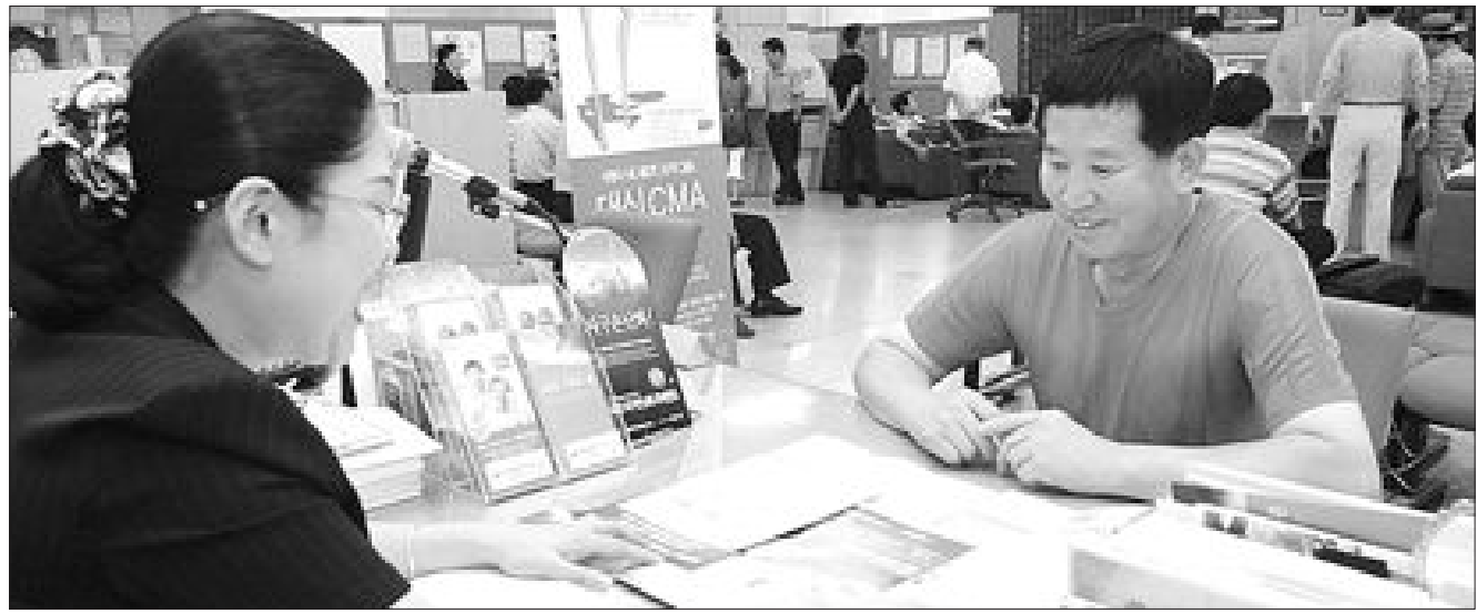
대신증권 무동지점 직원(왼쪽이) 10일 펀드가입을 고민중인 고객에게 주식형 펀드 상품에 대해 설명하고 있다.