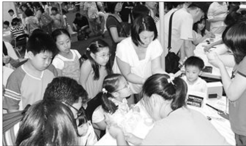
15일까지 경기도 고양 킨텍스에서 열리는 2007 대한민국과학축전 행사장에서 강진 마량초교 아이들이 행사장을 찾은 어린이들과 ‘신기한 거울놀이’ 체험을 하고 있다.

무게 중심의 원리를 쉽게 알 수 있는 광주 평동중 과학동아리 ‘한배움’팀의 ‘신기한 장구론과 더불어 체험 프로그램’도 찾는 이들이 많았다.