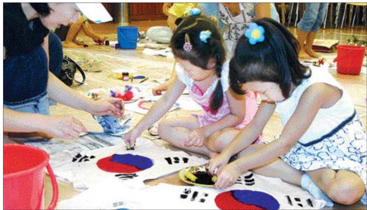
15일 광복절을 맞아 광주신세계백화점이 마련한 '태극기 그리기' 이벤트에 참여한 어린이들이 백화점 9층 문화센터에서 삼색물감으로 티셔츠에 태극기를 그리고 있다. (광주신세계백화점제공)

이밖에 수상한 삼성의 LCD TV는 부드럽고 투명한 곡선의 제품 하단 베젤 디자인으로 고급스러운 크리스탈 와인 잔의 모습을 형상화한 제품으로, 물 속에 퍼지는 느낌의 차분한 푸른빛 LED 조명을 통해 TV 품격을 한 단계 높였다.