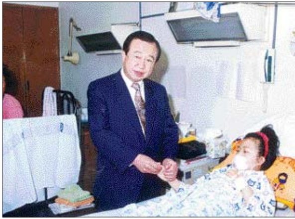
지난 1991년 당시 안준 광주시교육감이 재생불량성 빈혈을 앓고 있는 어린이를 찾아 위로하고 있다. <광주일보 자료 사진>

약력 ▲1933년 보성군 봉래면 출생 ▲광주교 광주시범학교 졸업 ▲광주시교육청 학무국장 ▲2, 3대 광주시교육청 교육감 ▲죽호학원 이사장