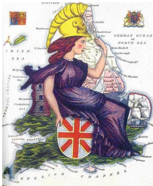
여왕을 묘사한 영국 캐리커처 지도(왼쪽)와 세계 최초의 바다지도인 포르투갈노 해도.