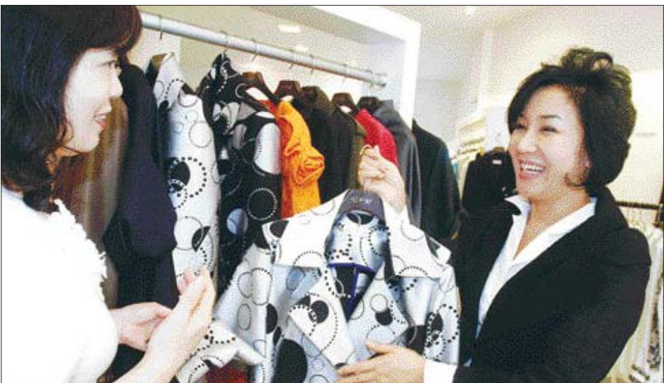
입추가 지난 요즘 광주 시내 백화점과 의류매장에는 가을의상을 구입하려는 여성들이 늘고 있다. 올 가을에는 물방울과 네모 무늬 등을 이용한 기하학적 패턴의 의상이 인기를 끌 전망이다.