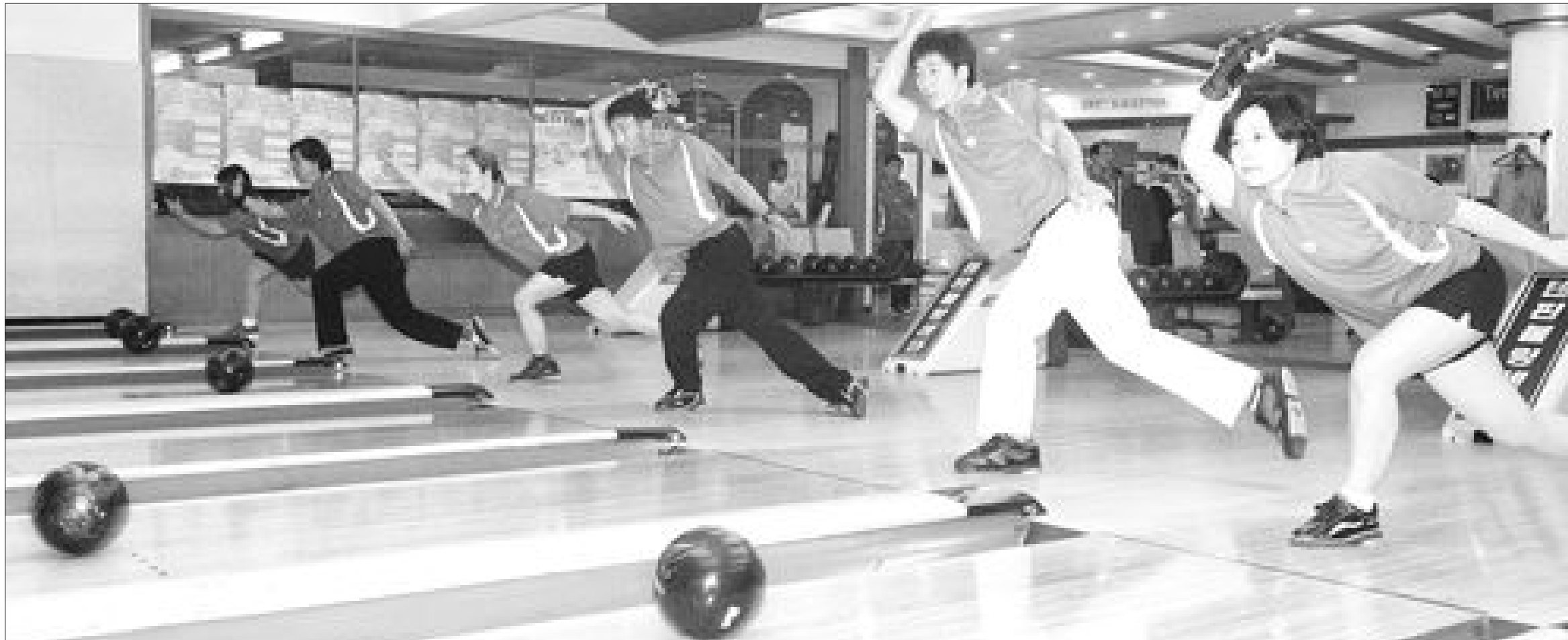
벨인퍼컴 남녀 볼링 준결승