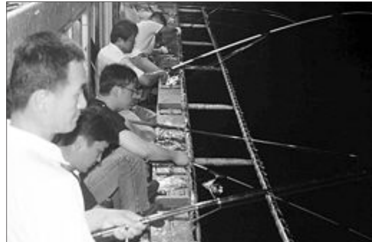
지난 21일 목포 평화광장 앞 바다에 수은등을 환하게 밝힌 낚시 어선에 탄 강태공들이 갈치 낚시에 푹 빠져 있다.

외지 강태공들 몰려 선상낚시 불야성 하룻밤 100마리는 거뜰 짜릿한 손맛'