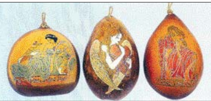
박충훈·양정희작 '여인 1,2,3'

전통적인 생활용품인 바가지의 재료에서 조경 식물로 밀려난 바의 새로운 가능성을 엿볼 수 있는 축제가 열린다.