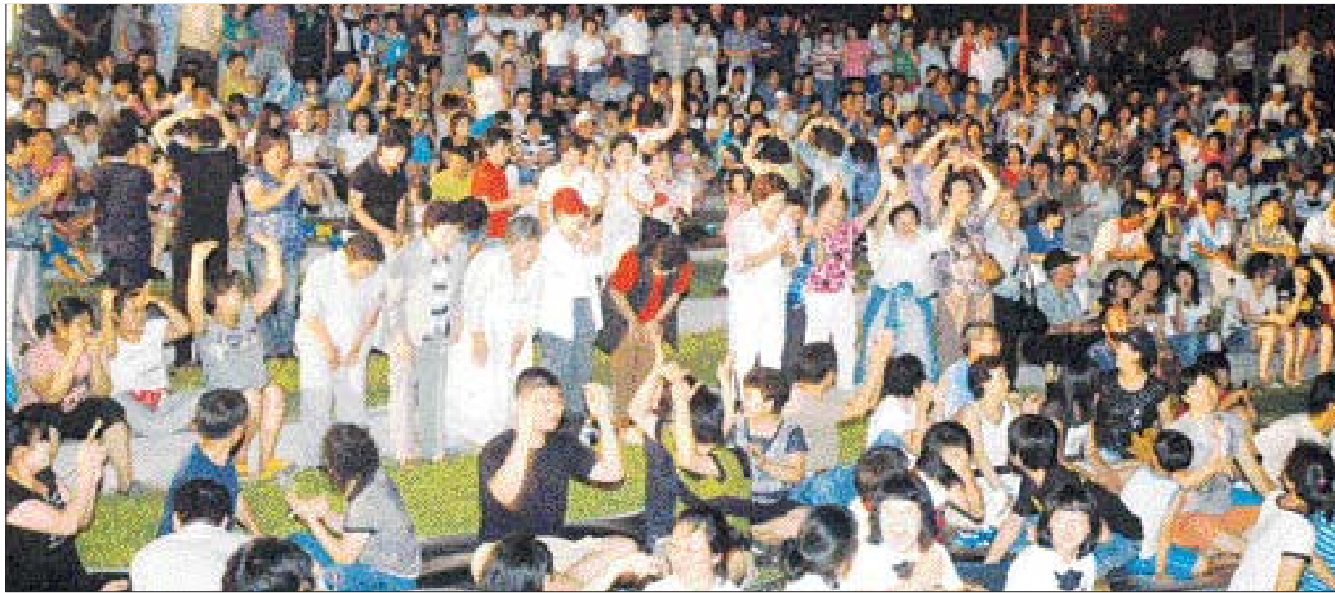
영화 '화려한 휴가'의 합천 상영이 시작되기 전 5월어머니회 소속 회원들이 인사를 올리자 관객들이 박수를 치고 있다.