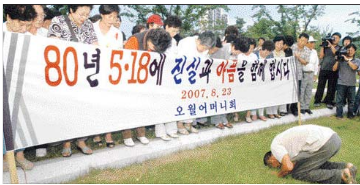
합천군민 한 사람이 5월어머니회원들에게 사죄의 큰 절을 올리고 있다.

장이다. 그러나 이같은 주장은 설득력이 없다. 합천군은 지난해 12월 공원 이름 변경과 관련, 설문조사를 했으나 그 대상은 도·군의원, 기관단체장, 이장, 새마을지도자 등 지역 유지 1천364명이었다. 이들을 상대로 한 조사에서도 '일해공원'을 선택한 응답자는 절반을 겨우 넘긴 51.1%에 불과했다. 전체 군민의 뜻으로 해석할 수 없다는 반론이 당장 제기됐다.