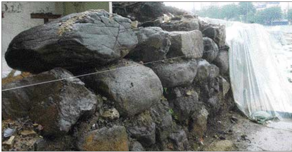
최근 문화재청으로부터 해체 후 원상복원 결정이 내려진 국립아시아 문화전당 내 광주읍성 성벽.

최근 문화재청의 해체 후 현장 복원 결정으로 국립아시아 문화전당과 공존하게 될 광주읍성이 광주의 뿌리같은 역사를 상징하는 유적으로 거듭나게 됐다.