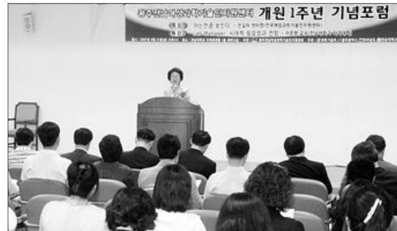
여성과학기술인 지원센터 개원 1주년 기념포럼

2009학년도 대학 입시에서부터 동일계 특별전형 이외의 전형에 진학하는 외국어고 등 특목고 졸업생들에 대한 비교내신제는 허용되지만 특목고 졸업자, 즉 재학생에 대해서는 허용되지 않는다. 지난달 31일 교육인적자원부가 확정·발표한 2009학년도 대입전형 기본계획에 따르면 ‘동일계 특별전형 이외의 전형에 지원한 특목고 졸업자의 경우 일반고등학교 졸업자와 동일한 기준 적용이 가능하다’는 문구가 새로 명