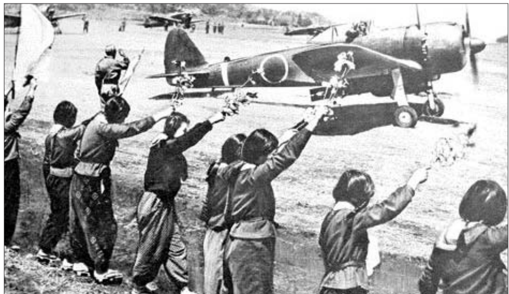
테러리스트의 원형으로 다뤄지고 있는 '카미카제' 특공대는 천황과 국가를 동일시한 맹목적인 애국자들은 아니었다. 1945년 4월 일본의 한 고등학교 학생들이 시쿠라 꽃가지를 흔들며 출격하는 특공대원을 환송하고 있는 모습.

우리나온 것이라 하기 힘들다. 하지만 천황 곁에서 죽는 것은 나에게 정해져 있다"는 내용의 일기를 남기도 했다. 카미카제 특공대원들은 이처럼 운명지위된 죽음을 자신에게 어떻게 이해시킬지 고뇌한 사람들이었다. 미국 위스콘신 대학 연구 전임교수인 오오누키 에미코가 쓴 '죽으라면 죽으리라-카미카제 특공대의 사상과 행동'은 전선에서 죽음을 강요받았던 카미카제 특공대원과 학도병들의 인간적인 고뇌와 갈등을 조명한 책이다.