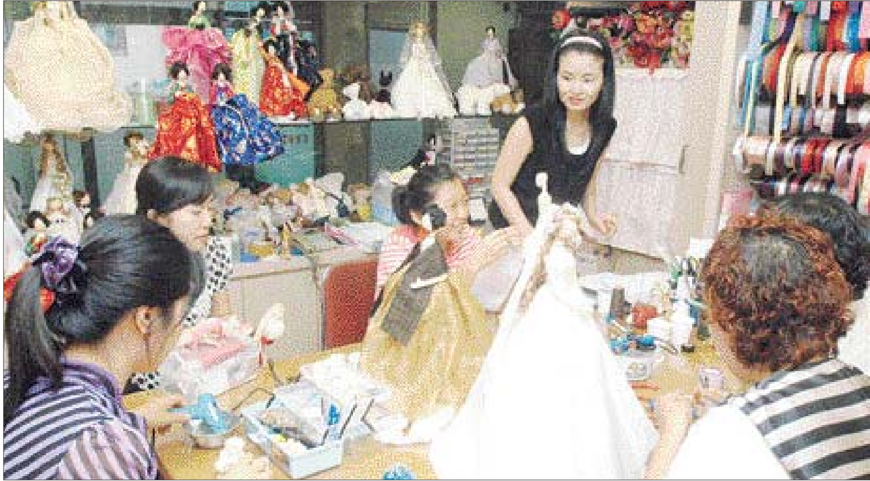
지난 30일 오후 광주시 동구 금남로2가 '쌈지마을' 인형공방에서 여성들이 형갈인형을 만들고 있다. 공방을 찾는 회원 중 95%이상이 20~30대 여성으로 젊은 여성들 사이에서 인기를 끌고 있다.