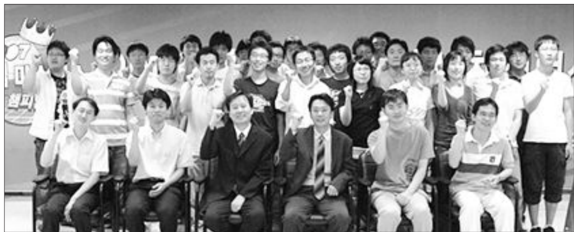
엠게임 마스터스 본선 진출자들이 화이팅을 외치고 있다.

며, 예선 조별리그를 통해 16강을 선발한 뒤 본선 토너먼트를 통해 최종 승자를 가린다. 제한시간은 예선 각 10분 초읽기 30초 2회이며 본선의 경우 각 20분, 초읽기 30초 3회가 주어진다. 대회 참가를 원하는 바둑인은 영암군 바둑협회와 전남바둑협회 시군지부에서 신청서를 받아 오는 5일까지 영암군 바둑협회에 우편제출하면 된다. 문의 061-464-8949. 참가비는 개인 1만원, 단체 3만원. <도지사배 부문별 참가자격> ▲일반부 갑조=1급~4급 이상인 자 ▲일반부 을조=5급 이상인 자 ▲여성부=만 20세 이상 여성 ▲단체부=직장 및 동호회 3인 1조 ▲학생부=도내 학교에 재학중인 중·고생 ▲초등고=초등 5~6학년 ▲초등 중=초등 3~4년 ▲초등 저=초등 1~2학년. /윤영기자 penfoot@kwangju.co.kr