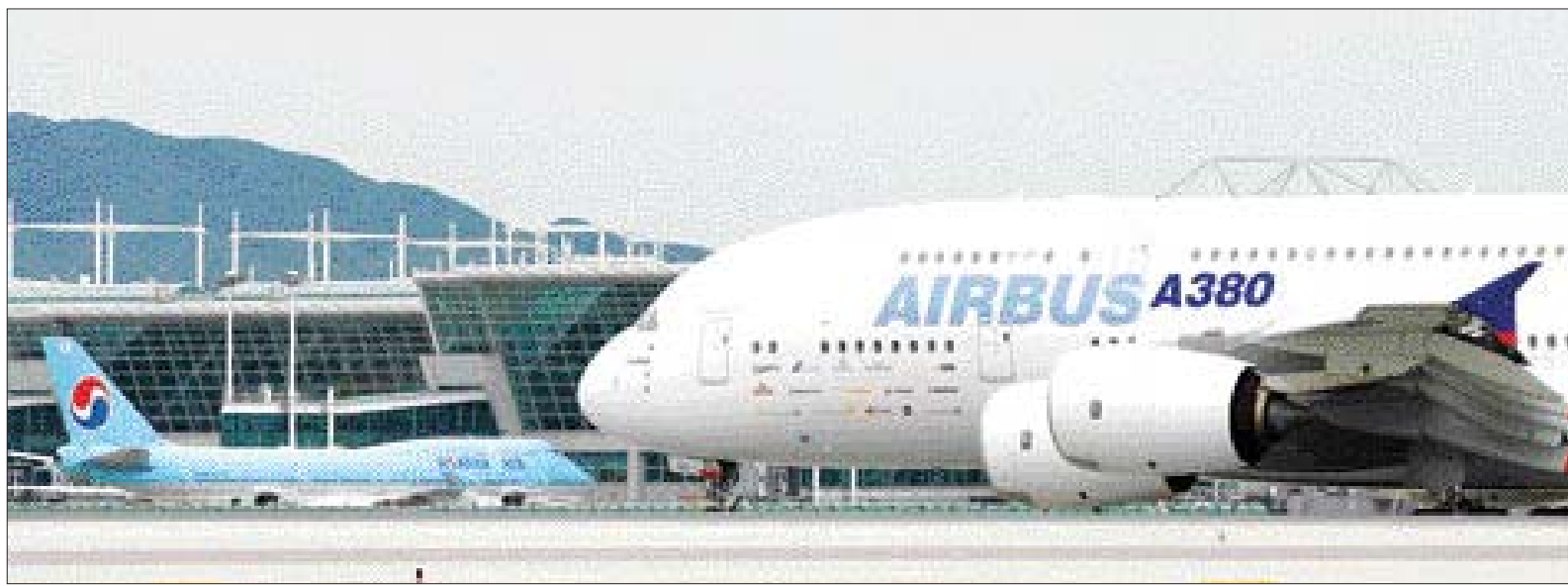
세계 최대 여객기 에어버스 A380이 5일 인천공항에 착륙한 뒤 계류장으로 이동하고 있다. A380은 6일 대한항공 체임 비행행사를 통해 한국에서 첫 시범운항을 하게 된다. /연합뉴스

한국수입자동차협회는 지난 8월 한달간 수입차 신규 등록대수가 지난해 8월에 비해 34.6% 늘어난 4천544대로 집계됐다고 5일 밝혔다. 이로써 올들어 지난 8월까지 수입차 신규 등록대수는 지난해 같은 기간에 비해 29.5% 증가한 3만4천399대가 됐다. 브랜드별로는 BMW가 가장 많은 669대로 2개월 연속 신규등록 1위에 올랐으며, 혼다 650대, 렉서스 648대, 메르세데스-벤츠 456대, 아우디 385대, 크라이슬러(크라이슬러·지프·닷지) 325대, 폴크스바겐 307대, 인피니티 253대, 푸조 248대, 볼보 201대 등이었다. 모델별로는 혼다 CR-V(334대), BMW 528(312대), 렉서스 ES350(294대) 순이었다. CR-V는 지난 7월 BMW 528에 신규등록 1위 자리를 내줬으나, 8월에 1위 자리를 탈환한 것이다. 배기량별로는 2천cc~3천cc 미만 1천846대(40.6%), 2천cc 미만 1천165대(25.6%), 3천cc~4천cc 미만 1천86대(23.9%), 4천cc 이상 447대(9.8%) 등이었다. /연합뉴스