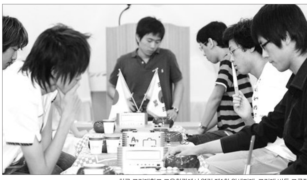
고려대-와세다대 바둑 교류전

최근 고려대학교 교우회관에서 열린 제1회 와세다대-고려대 바둑 교류전에서 양국 대학생들이 대국하고 있다. 고려대가 16대14로 승리.