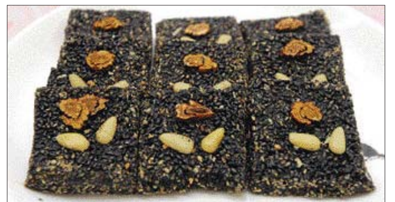
(도움 주신 분=김지현 요리학원 진미연구원·푸드스타일리스트 정강엽)