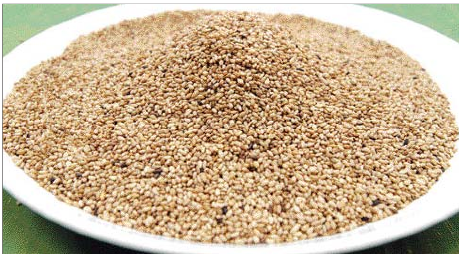
참깨는 노화를 방지하는 셀레늄, 필수영양소인 칼슘 등을 풍부하게 함유하고 있는 영양분의 보고다.