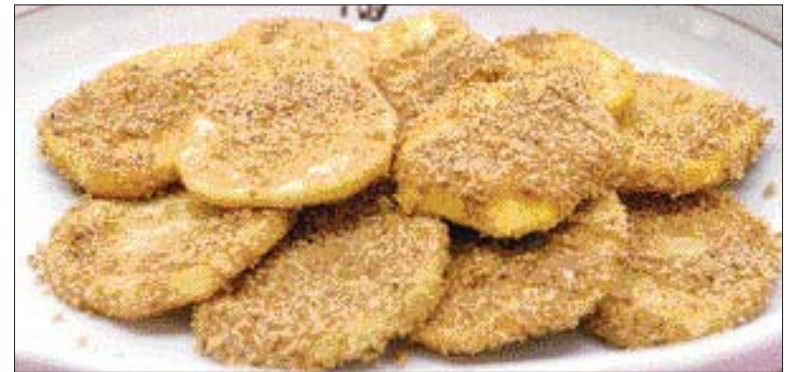
▲참깨 고구마 튀김=①참깨를 깨끗하게 씻어서 팬에 볶은 뒤 믹서로 간다 ②고구마는 잘라서 설탕물에 담근다 ③불기를 제거한 고구마를 튀겨서 꿀을 바르고 믹서로 참깨를 묻혀낸다.

/윤영기기자 penfoot@kwangju.co.kr