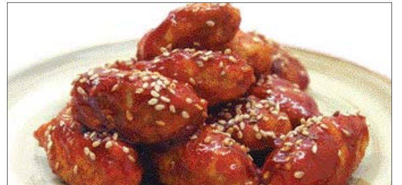
▲참깨 닭가슴살 치킨볼= ①닭가슴살의 물기를 제거한 뒤 잘게 다져 참깨가루를 섞는다 ②에다 밀가루 적당량 넣어 버무린다 ③고추장, 물, 물엿, 간장, 다진파마늘, 참깨기름, 후추 등을 넣어 고추장소스를 만든 다음 팬에서 굽는다.