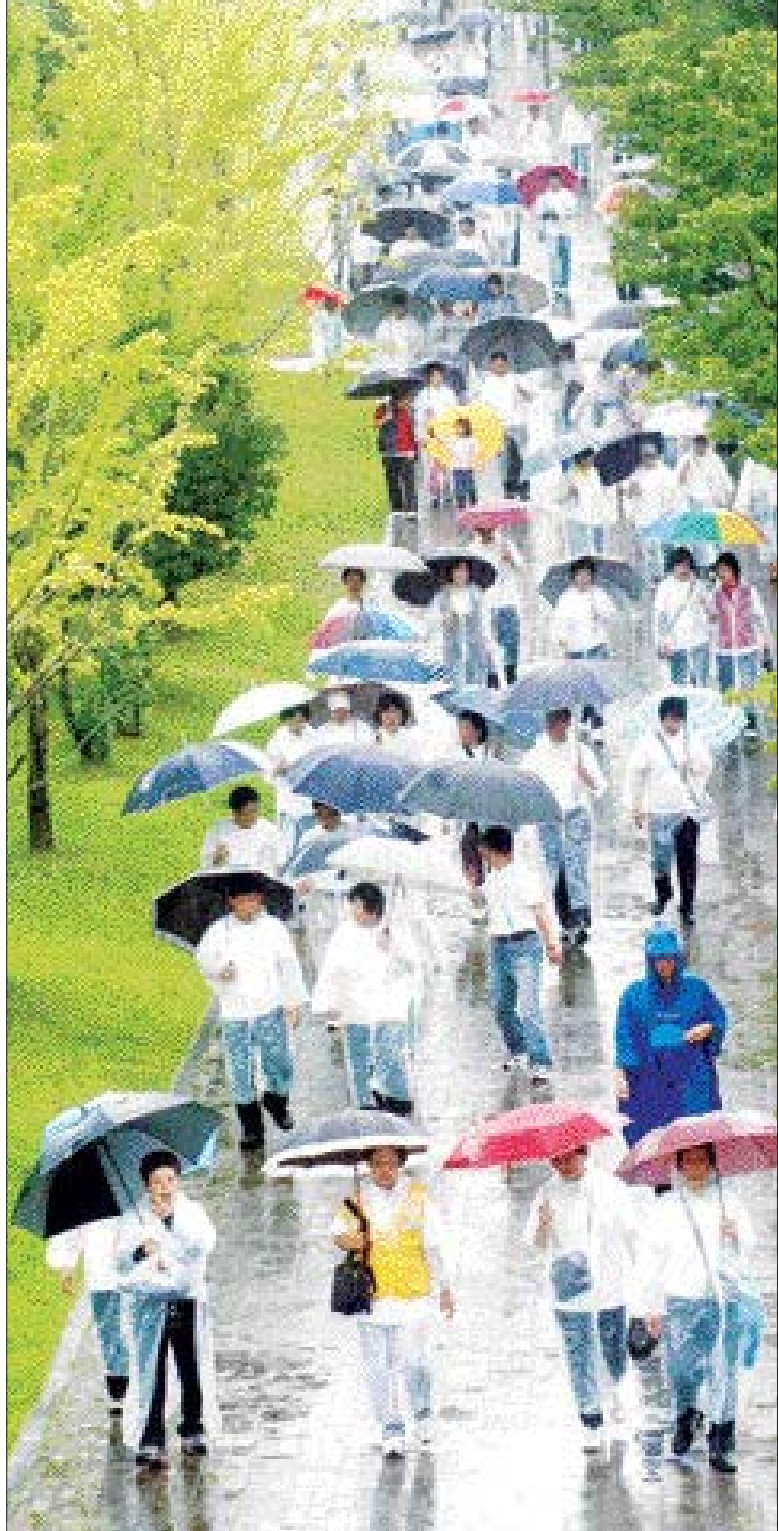
전국체전 서포터즈 ‘한마음 걷기대회’ 전국체전 서포터즈 등 3천여명의 광주시민들이 지난 15일 오전 광주월드컵경기장 보조경기장에서 ‘제88회 전국체육대회 서포터즈 발대식’을 가진 뒤, 비가 내리는데도 우산을 쓰고 주변 도로에서 ‘한마음 걷기대회’를 하며 체전 성공을 기원하고 있다.