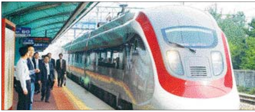
지난 12일 서대전~목포역 246.8km 구간을 시험운행한 한국형 틸팅열차(TTX·Tilting Train eXpress).

열차가 곡선 구간을 돌 때 바깥 쪽 수평 방향으로 작용하는 원심력, 수직 방향의 중력의 합력이 바깥쪽 대각선 방향으로 작용한다. 이때 열차가 기울어지면 원심력과 중력의 합력은 수직 방향의 중력과 거의 일치하게 돼 원심력 상쇄 효과를 거두게 된다.