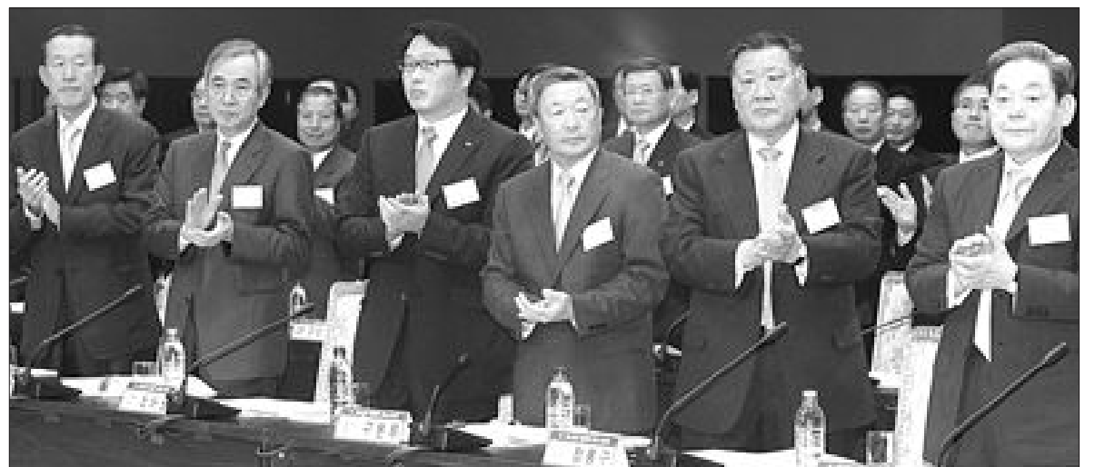
기업 상생협력 성과보고회 이구택 POSCO회장, 최태원 SK회장, 구부부 LG회장, 정몽구 현대기아차회장, 이근희 삼성회장(왼쪽부터) 등이 19일 오후 청와대 영빈관에서 열린 중소기업 상생협력 성과보고회에 참석, 노무현 대통령이 입장할 때 박수를 치고 있다.

자체 가운데 발전도도가 가장 낮은 낙후지역(지역1)에 신안·진도·곡성·구례·완도·함평·무안·해남·강진·장흥·보성·고흥군 등 12곳이 포함됐다. 또 '지역1' 보다는 발전한 곳으로 분류된 정체지역(지역 2)은 여수·순천·장성·영광·영암·화순·담양·나주 등 8곳이, 다음으로 발전도가 높은 성장지역(지역 3)에는 광주 시 5개 자치구와 목포·광양시가 포함됐다. 정부는 4단계 발전도에 따라 지자체별로 기업에 대한 법인세 차등 감면, 건강보험료 경감 등의 혜택을 차등적으로 적용할 계획이다. /박치경기자 unipark@kwangju.co.kr