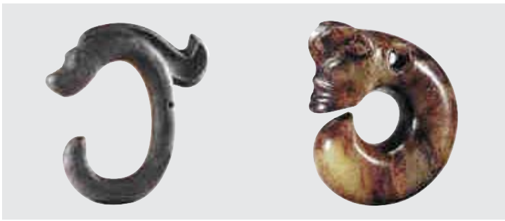
김희용씨가 수집한 ‘C’자형 옥(왼쪽·32.3cm) 조각상과 홍산문화 유적에서 발굴된 ‘C’자형 옥.