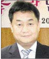
특색의 밀반찬 지원을 위해 설립된 센터는 해주주택건설이 초기 설립비용 3천만원을 지원, 남구주민생활네트워크가 운영을 맡고 남구청이 반찬 배달을 하게 된다.

“부모님께 늘 ‘어려운 사람 돕고 살라’는 가르침을 받았습니다. 그 가르