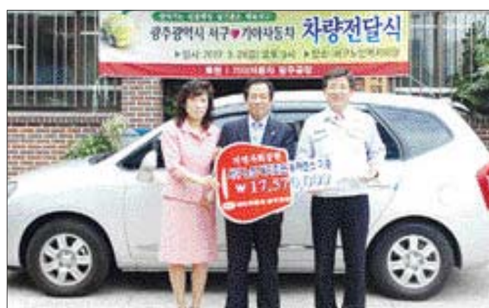
광주시 서구청은 21일 오후 광주 기아자동차에서 기증받은 카렌스 차량을 서구노인복지회관에 전달하고 노인들을 위문했다.