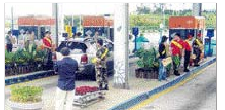
무안군과 한국도로공사 무안영업소, 무안해병정우회는 21일 오후 2시부터 고향을 찾는 귀성객들을 상대로 고속도로 지도와 무안 관광안내도를 나눠주며 ‘안전사고 예방 캠페인’을 벌였다.