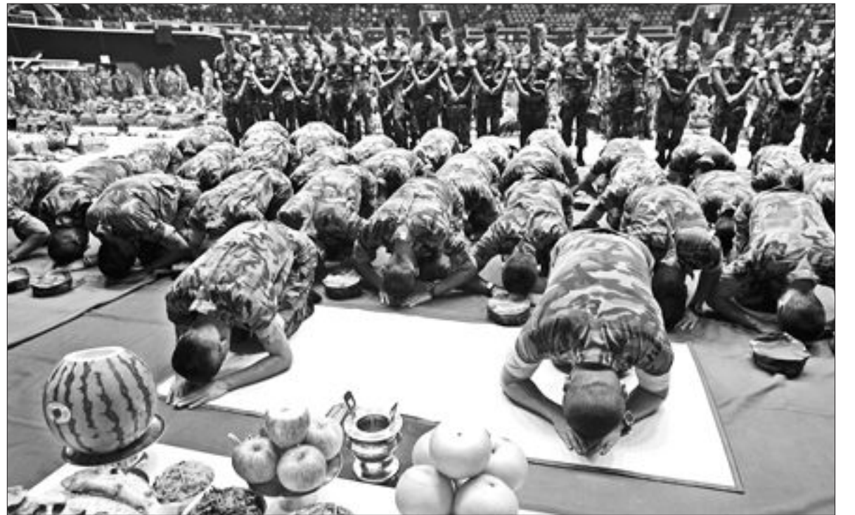
차례 지내는 해병대원

가운데 9위에 올랐다. 이에 비해 일본의 같은 기간 경유 및 휘발유 가격 상승률은 각각 21.5%, 20.0%에 그쳤다. 이 의원은 "국제 원유가가 폭등하자 정부는 고유가에 따른 서민과 중산층의 부담을 경감해주는 노력을 하기보다 유류세를 올려 세수를 늘리려 하고 있다"며 "정부는 즉각 유류세율을 10% 낮춰 서민의 생계비 부담을 덜고 경기활성화를 도모해야 한다"고 말했다. /박지경기자 jkpark@kwangju.co.kr