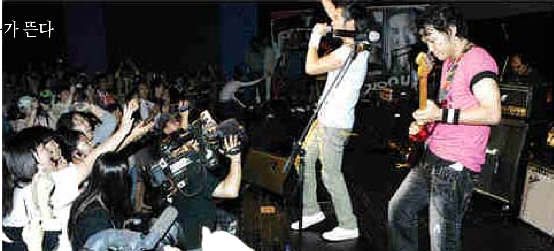
음악을 소재로 한 영화들이 속속 제작되고 있다. 사진은 영화 '즐거운 인생'의 출연배우들이 직접 무대에서 공연하는 모습이다.

음악과 영화는 '비늘과 실'같은 관계다. 적절히 사용된 음악은 영화의 감동을 배가시키고, 어떨 땐 영화의 줄거리보다도 음악이 먼저 떠오르는 경우도 있다. 어쩌면, 600만명 넘는 관객을 동원하며 흥행에 성공했던 영화 '미녀는 괴로워'의 주인공이 가수가 아니었다면, 그래서 한나가 부르는 '미리아'라는 노래가 등장하지 않았다면 흥행 파위가 줄어들었을지도 모른다. 최근 들어 '음악 영화'가 눈길을 끌고 있다. '음악'이 주 소재로 등장하는 영화들이 속속 제작되고 있고 외화의 경우도 오랜만에 뮤지컬 영화가 등장했다.