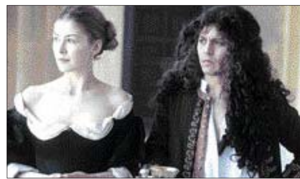
'리버틴' <15세 관람가>