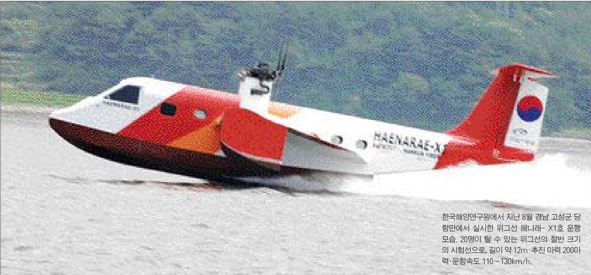
한국해양연구원에서 지난 8월 경남 고성군 당항면에서 실시한 위그선 해나라-X1호 운행 모습. 20명이 탈 수 있는 위그선의 절반 크기의 시험선으로, 길이 약 12m·추진 마력 200마력·운행속도 110~130km/h.