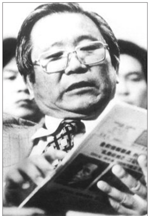
중앙정보부 퇴임 뒤 반 박정희 행각을 벌이던 김형욱씨의 미 하원 인권위 증언 당시 모습.