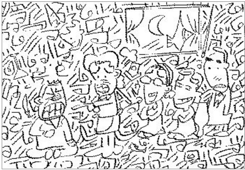
찾아(보)세(요) 새집, 고추, 송사리, A자, 열대어, 사람 열 얼굴, 불링핀, 양주잔, 바늘