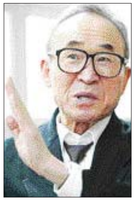
꽃 베티업 수상 황록 10대 1

영국의 유명한 도박 베티업체인 래드브록스(Ladbrokes.com)가 올해도 고은 시인을 유력한 수상 후보 중 한 명으로 올려놓았다.