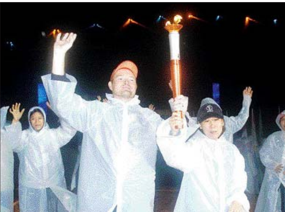
온누리안 성화 봉송 8일 채화돼 일주일간 제88회 전국체전을 밝혀줄 성화가 주 경기장내 제4주자인 다문화가족 부부 4쌍중 캐나다인 부부가 성화 봉송을 하고 있다.

빛의 교향곡... 무등산 높이를 작품 번호로 꿈도함께! 전진도함께! 영광도 함께! 라는 주제로 8일 열리는 제88회 전국체육대회를 하루 앞둔 7일 오후 광주월드컵경기장에서 개회식 공식행사 최종리허설이 펼쳐졌다. 빛과 광주의 열정을 매치한 식전행사, 광주의 상징인 무등산의 높이를 작품번호로 설정한 빛의 교향곡, 광주의 노래 등 식후행사가 체육제전을 더욱 빛냈다. 개회식에서 펼쳐질 화려한 공식행사를 화보에 미리 담았다.