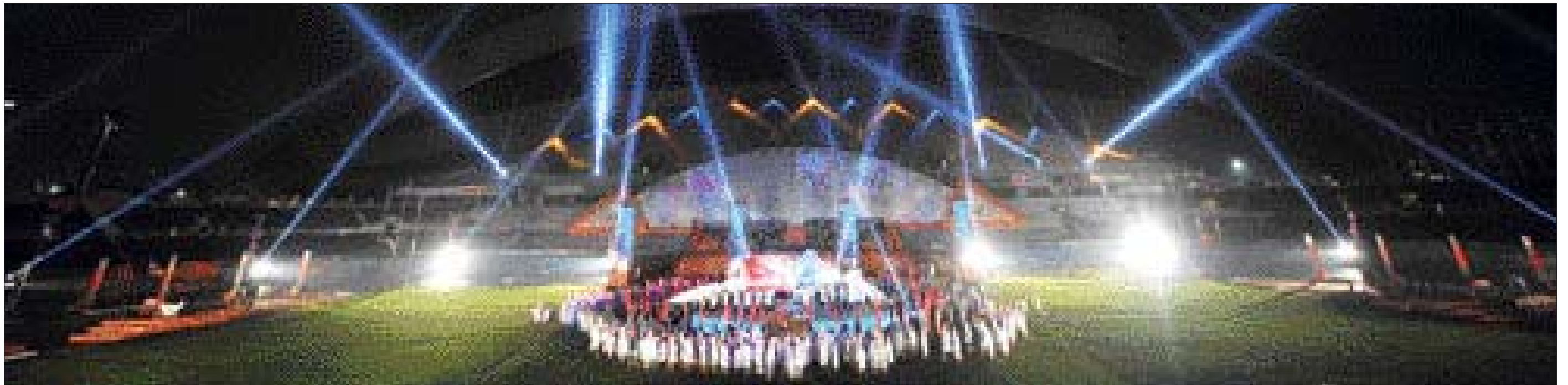
빛의 환타지 식후행사인 '빛의 교향곡'이 광주월드컵경기장에서 화려하게 연출되고 있다. 이 행사는 총 4악장으로 이루어져 있으며 '빛의 터 광주' '광주의 노래' 등 빛과 광주를 환상적으로 표현하고 있다.